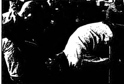
مطربون يرحبون أمام المصيرين وممثلات المسرحية بمسرح الأمل في الخليل، 23 مايو 1998.

الخليل 23 مايو (القدس) - شهدت الخليل مواجهات متفرقة بين الصوريين والفلسطينيين. وقالت الشرطة ان المواجهات وقعت بين عناصر من المجموعتين، وانه لا توجد أهداف سياسية. وأضافت ان الشرطة ستواصل مراقبة الوضع في الخليل.